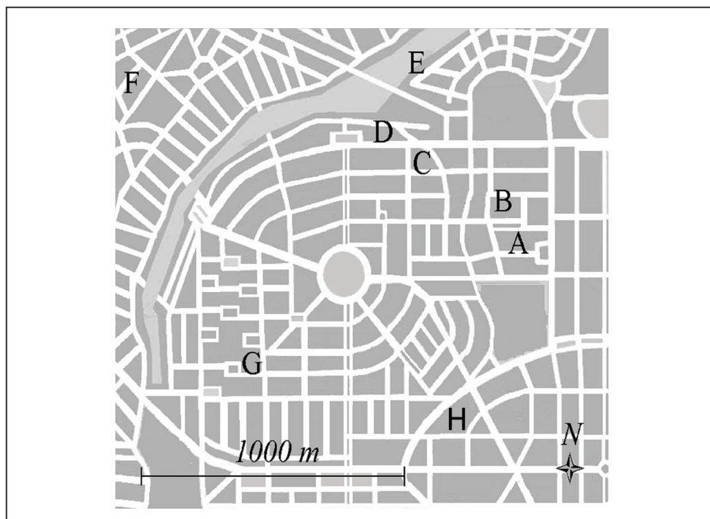
Figura 4 – Região de Goiânia com principais focos de contaminação. A – terreno de Roberto onde a fonte foi aberta; B – casa de Ovídio; C – ferro-velho de Devair; D – casa da fossa; E – ferro-velho de Ivo, pai de Leide das Neves; F – ferro-velho de Joaquim; G – Vigilância Sanitária; H – Instituto Goiano de Radioterapia.

O passo seguinte foi encontrar um físico. Este foi fazer medidas e confirmou altíssimo nível de contaminação, não só na Vigilância Sanitária, mas em várias localidades da cidade de Goiânia, posteriormente mapeadas como se pode ver na Figura 4.