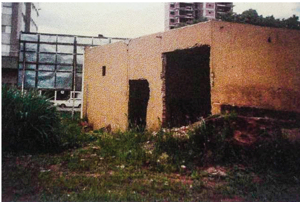
Figura 3 – Instituto Goiano de Radioterapia em abandono, de onde dois catadores de sucata carregaram parte de um aparelho de radioterapia contendo fonte de Cs-137.